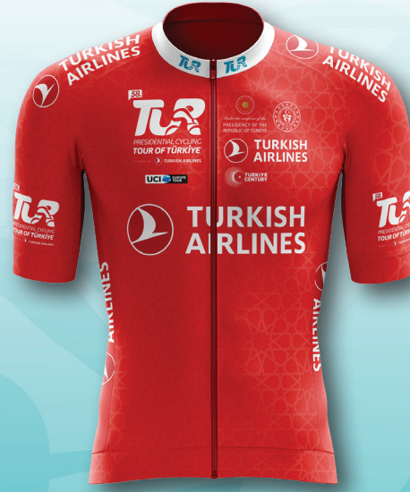
Kırmızı / Red En İyi Tırmanışçı King of the Mountain