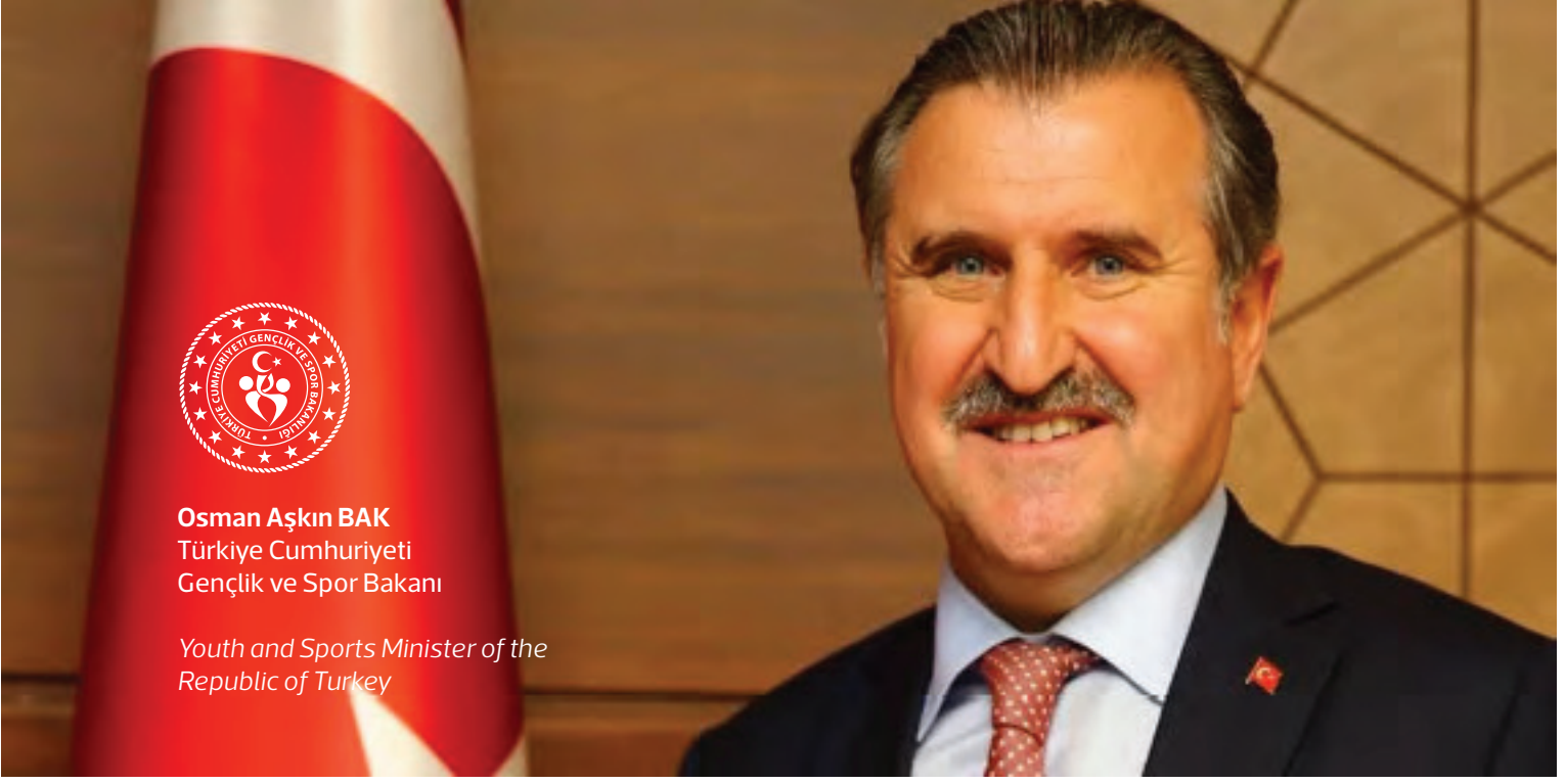
Osman Aşkın BAK Türkiye Cumhuriyeti Gençlik ve Spor Bakanı

Youth and Sports Minister of the Republic of Turkey