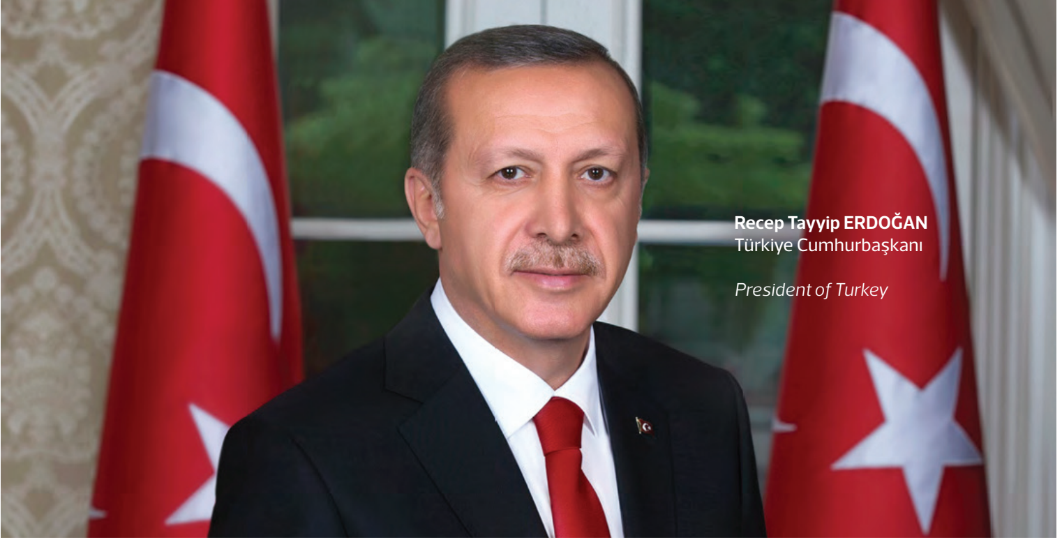
Recep Tayyip ERDOĞAN Türkiye Cumhurbaşkanı