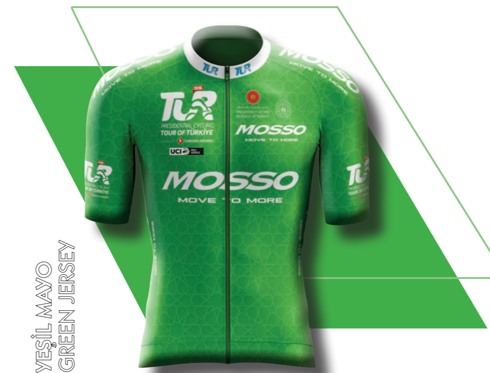
YEŞİL MAYO GREEN JERSEY