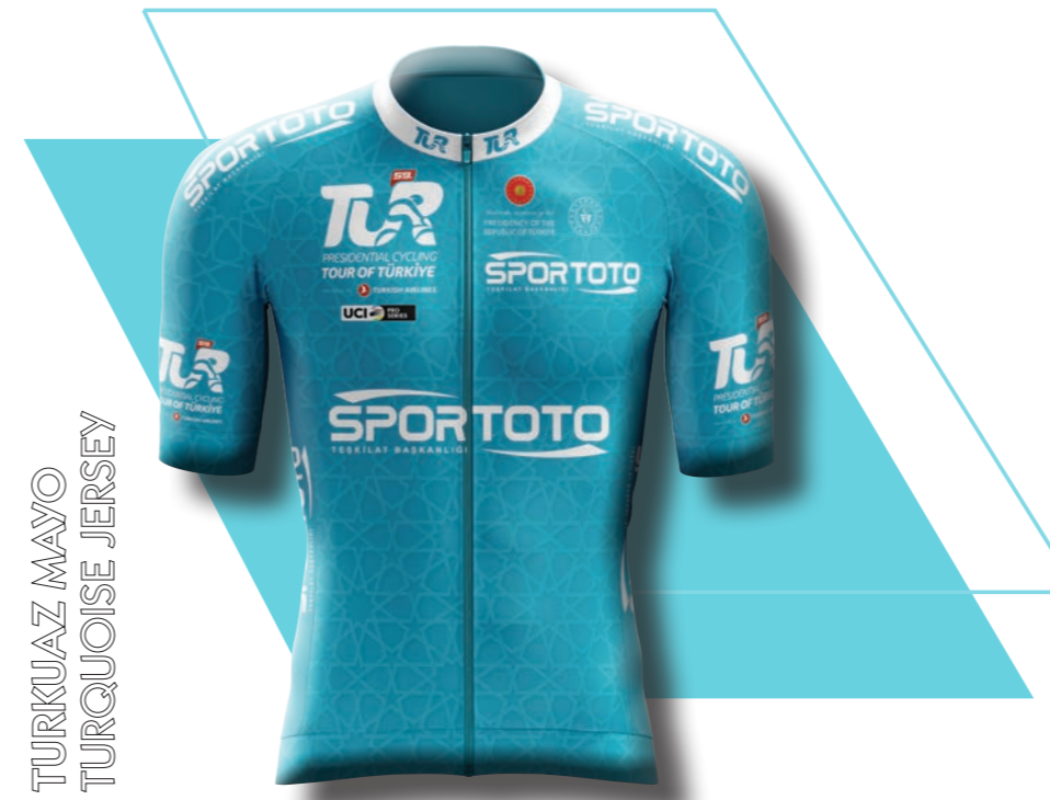
TURKUAZ MAYO TURQUOISE JERSEY