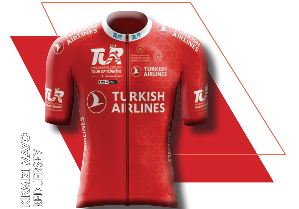
KIRMIZI MAYO RED JERSEY