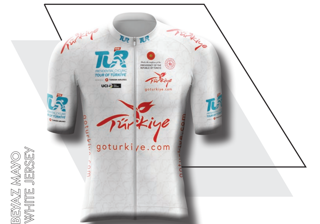
BEAZ MAYO WHITE JERSEY