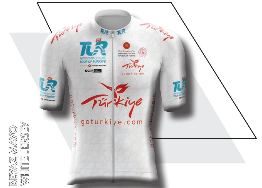
BEAZ MAYO WHITE JERSEY