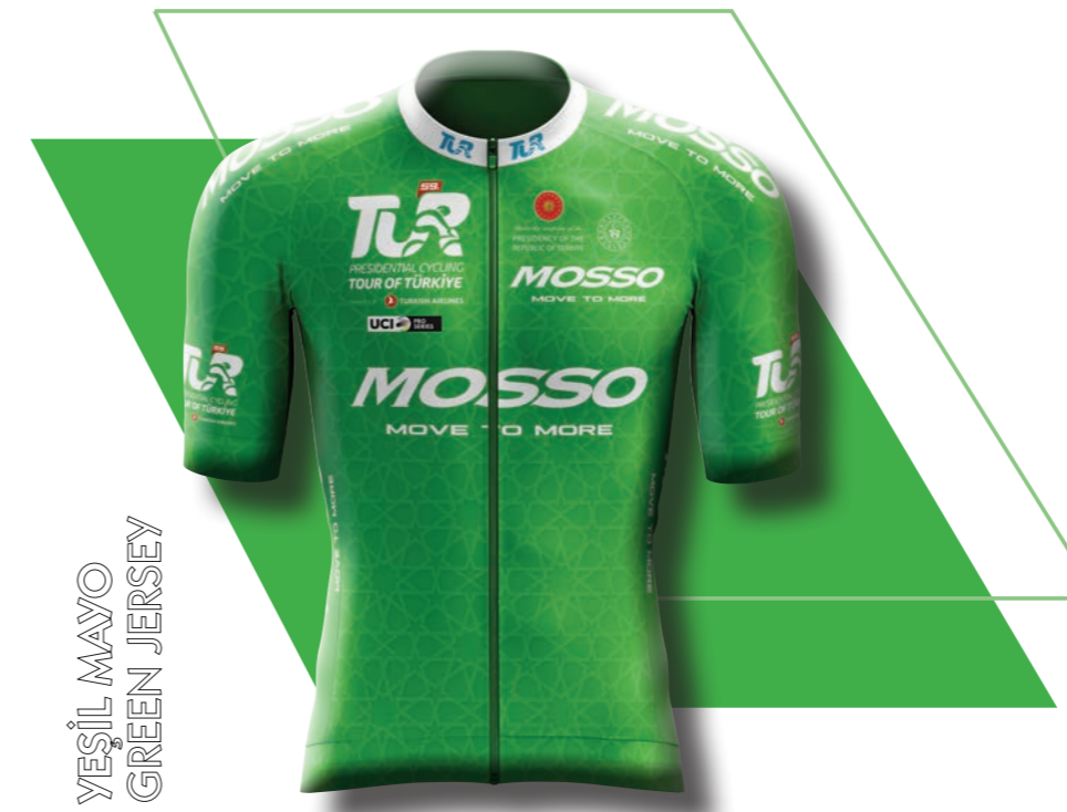
YEŞİL MAYO GREEN JERSEY