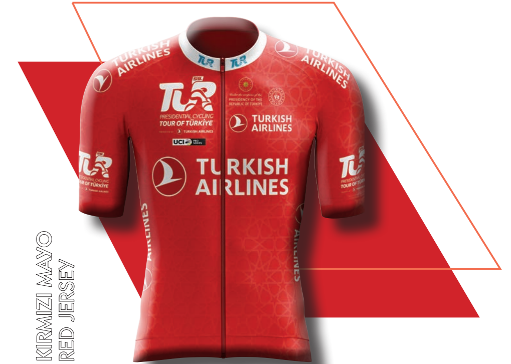
KIRMIZI MAYO RED JERSEY